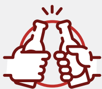
Bares e baladas

O Bairro Centro de Passo Fundo possui apartamentos de diversos estilos, além de muitas praças para você tomar aquele chimarrão com os amigos ou curtir um cineminha no Bella Città Shopping Center .